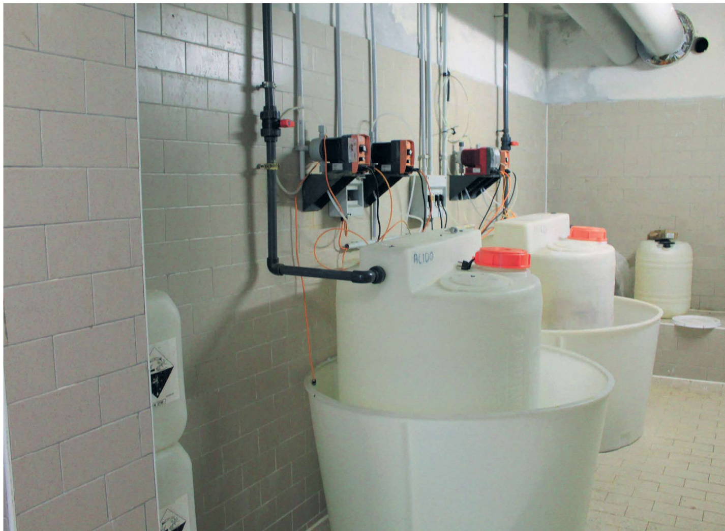
Stazione di dosaggio